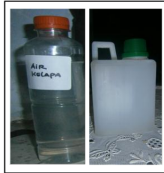
Gambar 5. POC Dan ZPT Air Kelapa Dikemas Dalam Botol