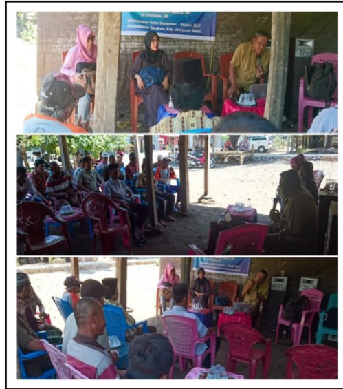
Gambar 3. Penyuluhan Teknologi Budidaya Bawang Merah Ramah Lingkungan.