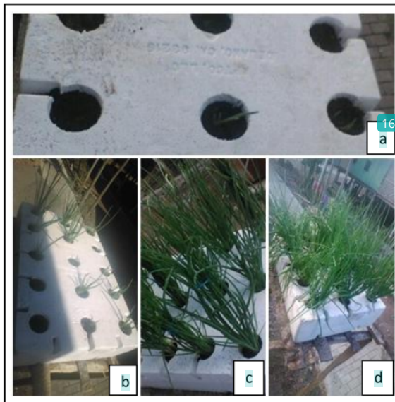
Gambar 8. Pertumbuhan dan perkembangan tanaman bawang mulai umur 1 HST (a), 7 HST (b), 42 HST (c) sampai 52 HST (d).