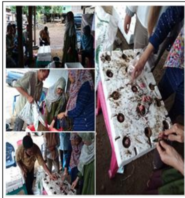
Gambar 6. Penanaman Umbi Bawang Merah Dalam Bak Styrofoam, 2017.

7 jarak tanam yang teratur yaitu 10 x 10 cm di setiap lubang tanam ditanami satu umbi bawang merah yang telah dipotong ujungnya untuk memudahkan keluarnya tunas (Gambar 6).