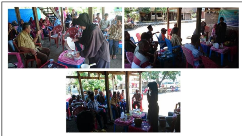
Gambar 4. Pembuatan Pupuk Organik dan Zat Pengatur Tumbuh

Praktek pembuatan POC dan ZPT dilakukan oleh anggota kelompok tani dipandu oleh Tim Pengabdian (Gambar 4). Hasil dari praktek tersebut berupa POC dan ZPT organik dikemas dalam botol (Gambar 5).