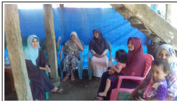
Gambar 2. Survey lokasi tim pelaksana dengan anggota kelompok tani mitra

Pada kegiatan survey lokasi tim pengabdian melakukan koordinasi dengan anggota kelompok tani (Gambar 2) untuk membicarakan rencana pelaksanaan program pengabdian.