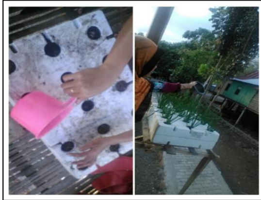
Gambar 7. Penyiraman pada tanaman bawang dalam umur 1 hari setelah tanam (HST) (Kiri) dan 40 HST (Kanan).

tanam mulai umur tujuh hari setelah tanam sampai umur 52 hari setelah tanam. Gambar 8 juga menunjukkan bahwa pada umur 52 hari setelah tanam tanaman bawang merah tumbuh dengan subur tanpa banyak input hanya dengan menggunakan bahan-bahan alami sehingga sifatnya ramah lingkungan.